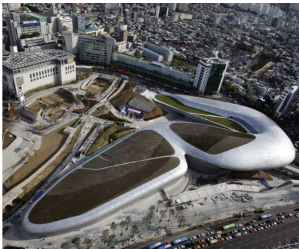
Nova građevina DDP -a snimljena s različitih položaja